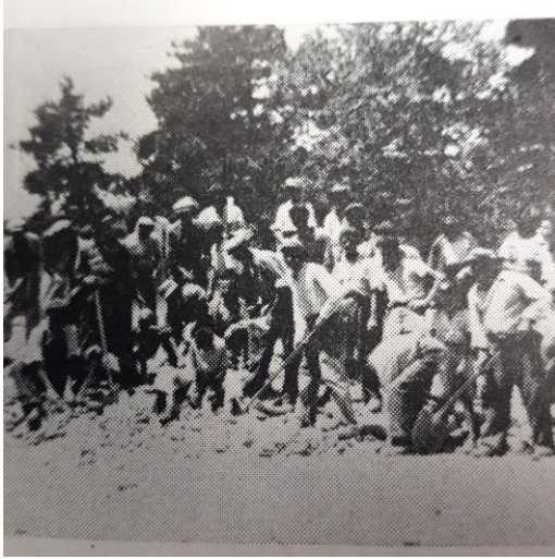
Οι εργασίες γκρεμίσματος του Ματαλείου