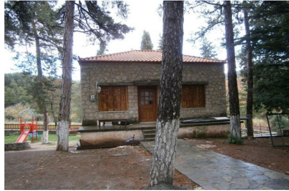
Το κτίριο της βιβλιοθήκης

Το κτιριακό σύμπλεγμα ολοκληρώνεται με την κατασκευή των αποχωρητηρίων την δεκαετία του 1950, και της βιβλιοθήκης το 1970. Ειδικότερα το κτίριο της βιβλιοθήκης κατασκευάστηκε με τη διαθήκη του Παναγιώτη Χρ. Πίτσιου πρωτοβουλία του Κων/νου Θ. Διαντζίκη και λειτούργησε επί σειρά ετών.