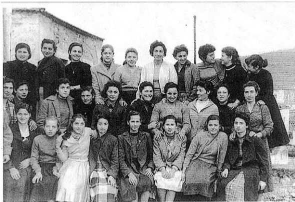
Νέες Καρυάτιδες στην Χ.Ε.Ν. την δεκαετία του 1950