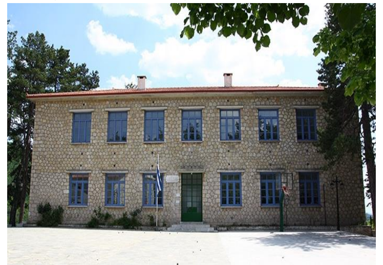
Το σημερινό κτίριο

Ωστόσο, από τη δεκαετία του 1980 όλα τα βιβλία μεταφέρθηκαν στο Κοινοτικό Κατάστημα, όπου ακόμα και σήμερα λειτουργεί δανειστική βιβλιοθήκη.